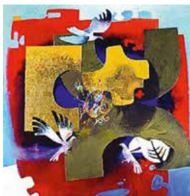
Arcabas - Trinité